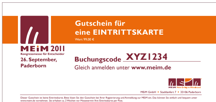
Gutschein für die Eintrittskarte

Ein häufig vernachlässigter Aspekt der Einladungen sind die eingesparten Außendienstkosten für den ersten Kundenbesuch mit ungewissem Ergebnis. Anders auf der MEiM: Sie empfangen potenzielle Neukunden in Ihrem Vortrag und/oder auf Ihrem Messestand. Dort haben Sie alle Informationen parat und können weitere Schritte bis zur Auftragsvergabe vereinbaren.